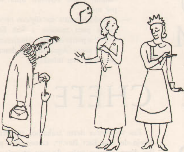
... A Maria manda dizer que a senhora não se lembrou da dieta da prima da Senhora...