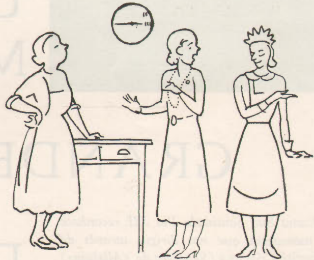
... Está lá dentro a lavadeira que pede desculpa de vir a estas horas mas que se escangalhou a camioneta...