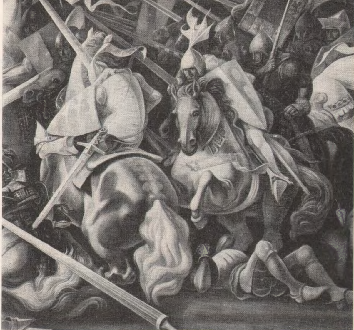
Batalha dos Atoleiros Palácio da Justiça de Fronteira

para os CTT, só não transigindo com esquivas à autenticidade, ou com processos que ele sabia serem impróprios e condenáveis pelas exigências das artes gráficas.