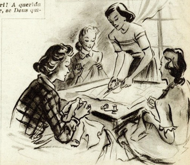
Era a primeira reunião depois das férias