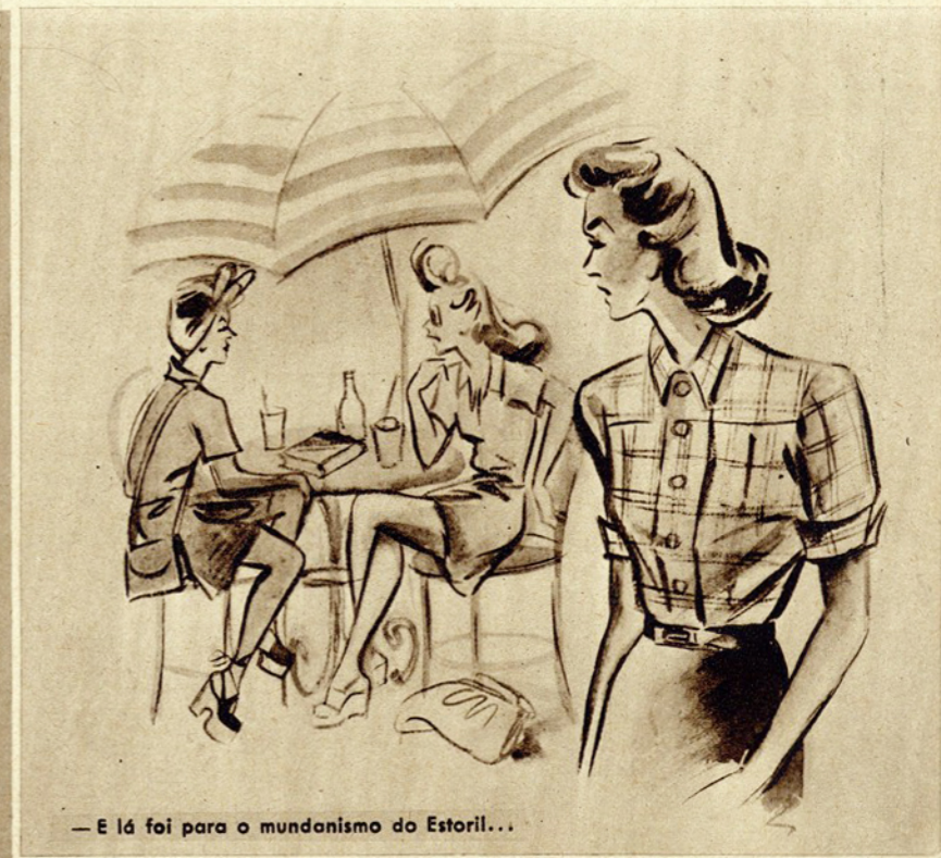
— É lá foi para o mundanismo do Estoril...

— Um bravo à menina do dia! — aplaudiu a impetuosa Joana.