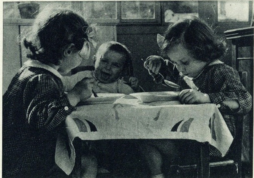
Os filhos são sempre uma alegria no lar!