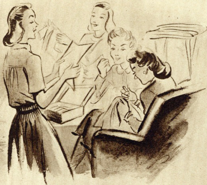
— A novidade que lhes trago é uma receita de cozinha...