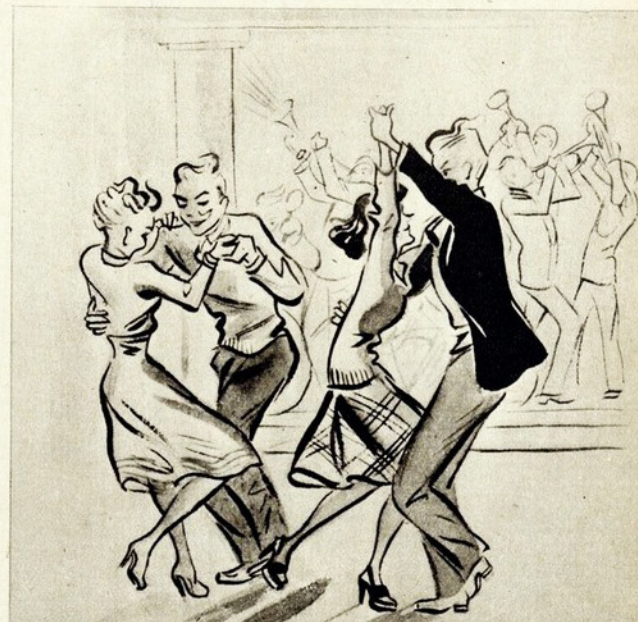
Como se dança hoje...