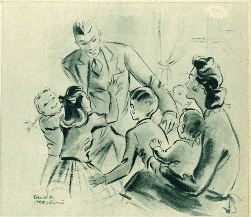
«O marido encontra-a sempre sorridente e fresca no meio do rancho dos filhos»...