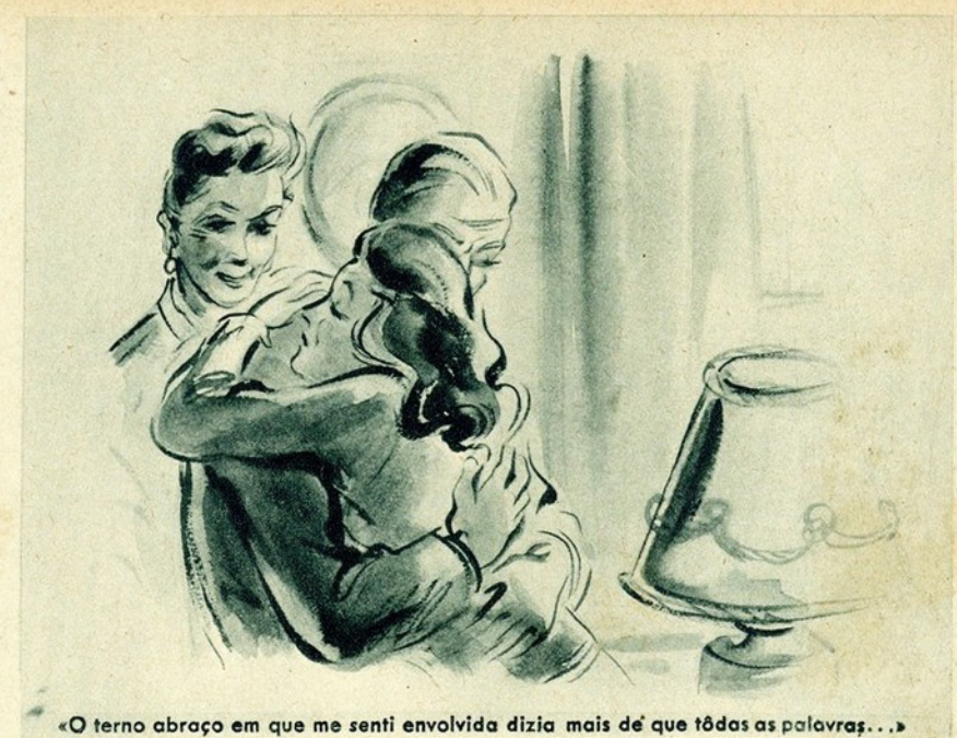
«O terno abraço em que me senti envolvida dizia mais de que tódas as palavras...»

Pareceu-me que, de repente, me tiravam de cima das costas um rochedo! E, nessa mesma tarde, esquecendo a minha zanga por ela ter feito segredo do seu noivado,