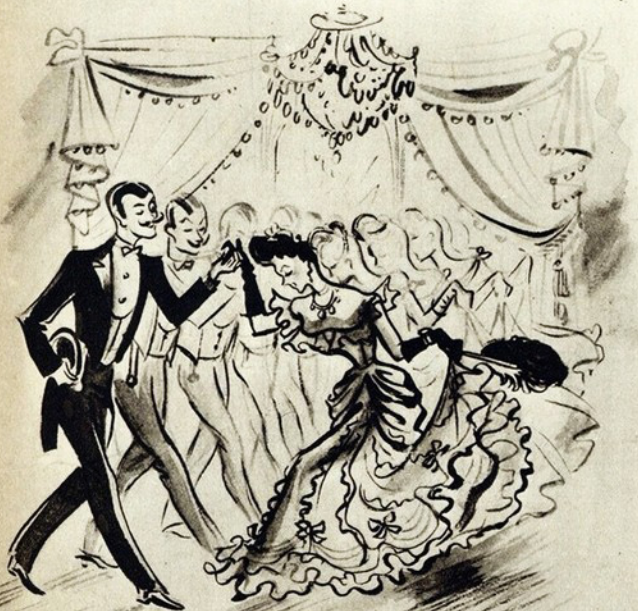
Como se dançava antigamente...