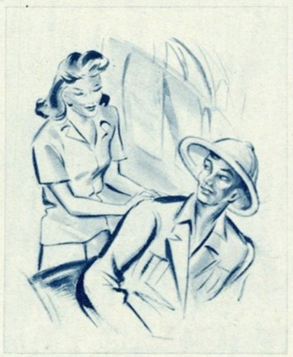
Sente-se, já, meu querido doente!

Tocou uma sineta; e logo saiu da capela um enorme rancho de pretinhas, com lenços brancos nas cabeças encarapinha-