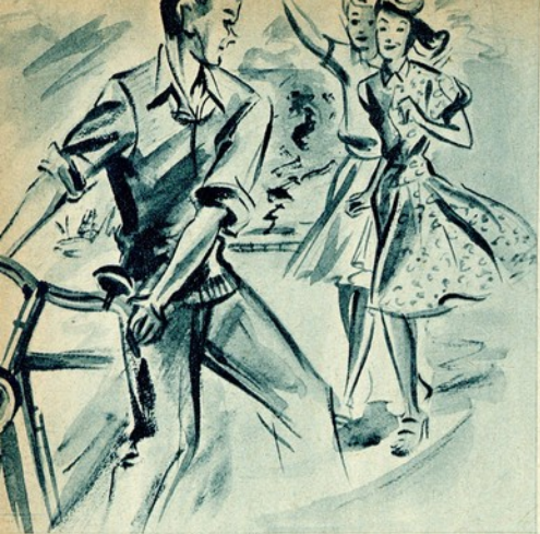
Olá! gritou elle correndo para elas e descendo da bicicleta com um enorme salto